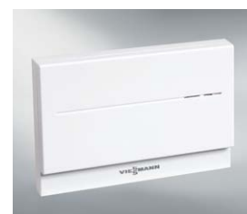
Moduł komunikacyjny Vitocom 100 (typ LAN1)

Dowiedz się więcej na specjalnej stronie internetowej: www.viessmann.pl/spokojnaglowa lub pod numerem infolinii: tel. 801 0 801 24